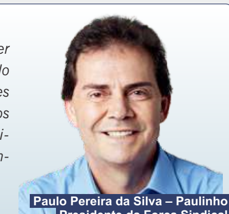
Paulo Pereira da Silva – Paulinho Presidente da Força Sindical e deputado federal