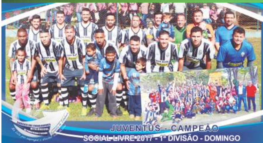
JUVENTUS - CAMPEÃO SOCIAL LIVRE 2017 - 1ª DIVISÃO - DOMINGO