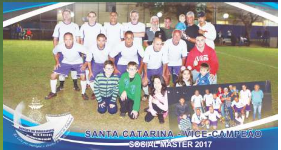
SANTA CATARINA - VICE-CAMPEÃO SOCIAL MÁSTER 2017