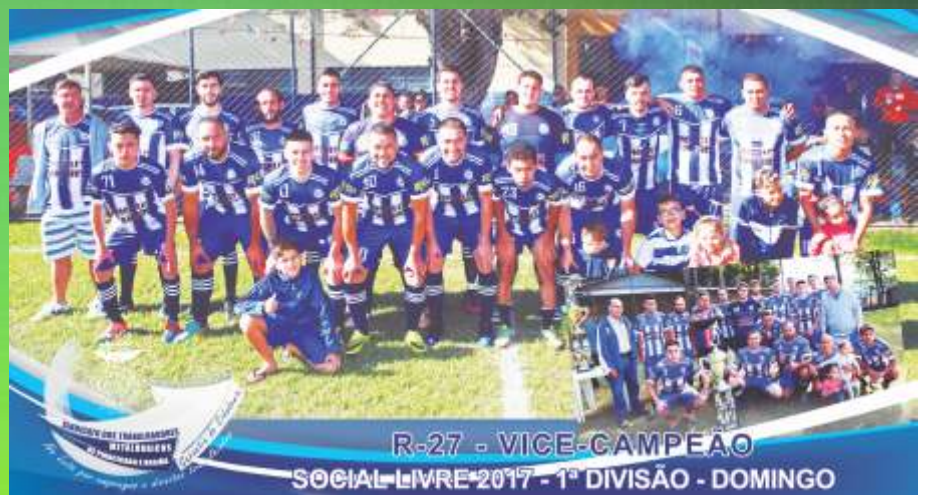
R-27 - VICE-CAMPEÃO SOCIAL LIVRE 2017 - 1ª DIVISÃO - DOMINGO