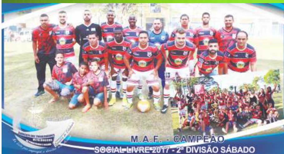
M.A.F. - CAMPEÃO SOCIAL LIVRE 2017 - 2ª DIVISÃO SÁBADO