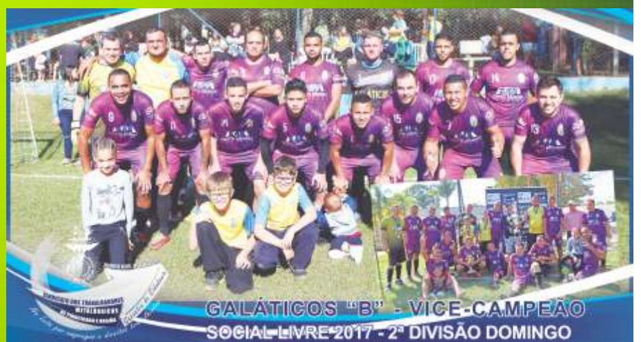
GALÁTICOS "B" - VICE-CAMPEÃO SOCIAL LIVRE 2017 - 2ª DIVISÃO DOMINGO