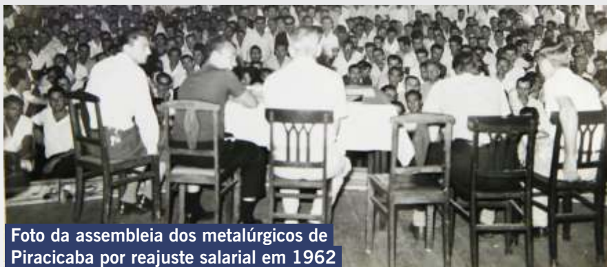
Foto da assembleia dos metalúrgicos de Piracicaba por reajuste salarial em 1962

Em 1947, foi fundado o Sindicato dos Trabalhadores Metalúrgicos de Piracicaba e região. Os primeiros anos do sindicato foram dedicados à sua estruturação física. Foi preciso contratar os primeiros advogados, dentistas e médicos para atender as necessidades iniciais dos trabalhadores.