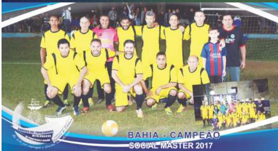
BAHIA - CAMPEÃO SOCIAL MÁSTER 2017