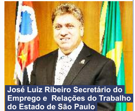
José Luiz Ribeiro Secretário do Emprego e Relações do Trabalho do Estado de São Paulo

ativa na tomada de decisões de instituições políticas, educacionais e de representação de outras categorias é essencial para que possamos influir positivamente no planejamento estratégico do município para o futuro.