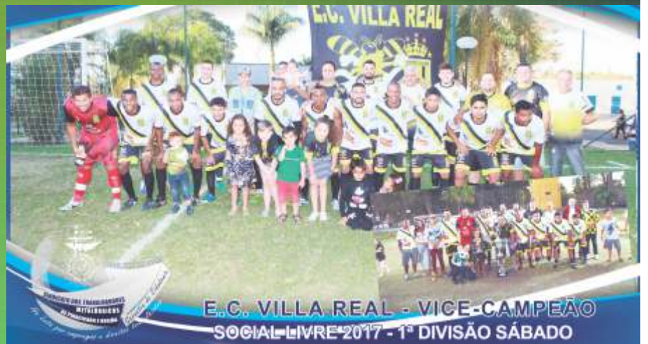
E.C. VILLA REAL - VICE-CAMPEÃO SOCIAL LIVRE 2017 - 1ª DIVISÃO SÁBADO