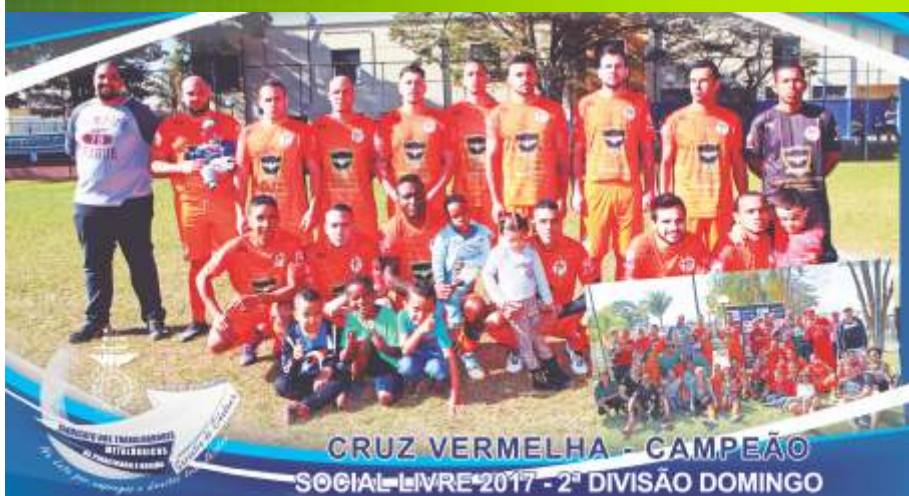
CRUZ VERMELHA - CAMPEÃO SOCIAL LIVRE 2017 - 2ª DIVISÃO DOMINGO